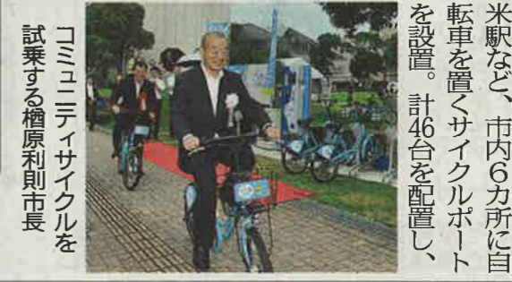
米駅など、市内6カ所に自転車置き場を配置し、計46台を配置し、

自転車貸し出し「くるクル」出発式 久留米市 久留米市で27日、自転車貸し出し事業「久留米市コミュニティサイクル」の運用が始まった。公募で決まった愛称は「くるクル」。市民や観光客に親しまれる新たな交通手段としての浸透を目指す。 JR久留米駅や西鉄久留